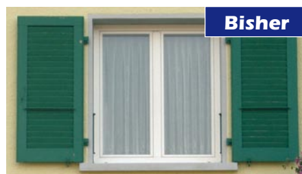
Konventionelles Fenster: Meist breite Rahmen und weniger Lichteinfall