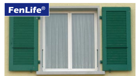
FenLife®: Schlanke Rahmen und mehr Lichteinfall